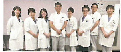
産科婦人科医師 スタッフ