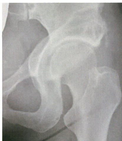
寛骨臼蓋回転骨切り術

対象疾患は、変形性股関節症、大腿骨頭壊死症、関節リウマチの股関節症などです。症状の変化やX線検査の結果を参考に現在と将来を見据えた上でどのように対処していくのが良いか、患者さんとじっくりと話し合いながら治療方針を決めていきます。