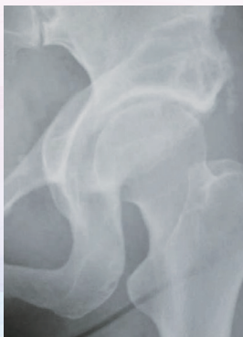
寛骨臼蓋回転骨切り術