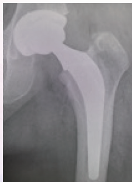
人工股関節全置換術