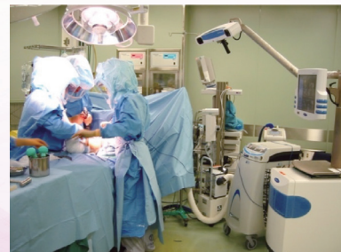
人工股関節全置換術 (ナビゲーションシステム)

受診希望の方は紹介状をご用意の上、予約センター (03-5923-3240) までお電話ください。