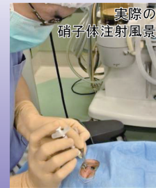
実際の 硝子体注射風景