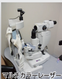
マルチカラーレーザー