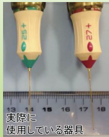
実際に 使用している器具