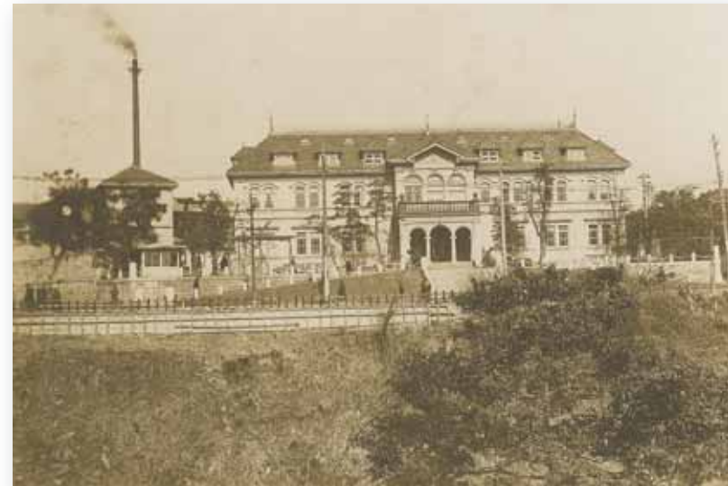
明治40年代の順天堂医院