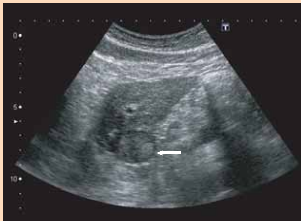
図の解説;腹部超音波で発見された約3cmの肝がん(矢印)

一方、胆道系(胆汁の通り道)、すい臓(膵臓)にできるがんは、早期発見が困難であります。胆道がんは、胆管がん、胆嚢がん、十二指腸乳頭部がんに分類され、そのリスクファクター(ある疾患の原因あるいは指標となる因子)としては胆石、胆嚢炎、膵胆管合流異常症(胆管と膵管が十二指腸に流れる手前で合流する先天性異常)があげられます。最も多い症状は胆道にがんができたことで、胆汁が流れにくくなることによる肝機能異常や黄疸です。40歳を過ぎたら血液検査や、超音波検査などで早期発見のための検診をうけるのが望ましいでしょう。また、膵臓がんは近年増加しているにもかかわらず、ほとんどの患者さんが手術できない状態で発見されています。初期症状に乏しく、進行してから腹痛や体重減少、血糖値上昇、黄疸などで気づかれることが多い病気です。血糖値の急激な上昇、血清アミラーゼといった膵酵素に上昇がみられた際には腹部超音波検査、血液中の腫瘍マーカーを調べておいたほうがよいでしょう。