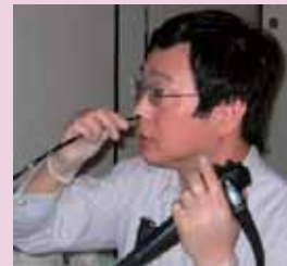
*医師自ら経鼻内視鏡の感触を確認しました。これなら安心して受けられます。

そしてここで再検査(内視鏡)を勧められたら、当院にお越しください。今まで内視鏡は辛いから、とためらっていた方々のために、『経鼻内視鏡』を導入しました。今までの検査に比べて遙かに楽に検査が受けられます。