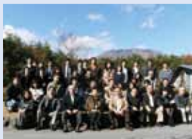
天候にも恵まれ、気分を変えて、病院業務改善について取り組むことが出来ました。