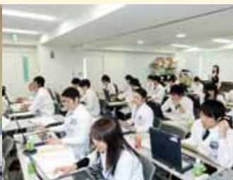
電子カルテ練習の様子