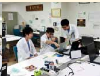
臨床研修センターでの様子

当院では、基本コース 定員 25 名、また平成 22 年度より募集を開始した小児科コース、産科コース 各定員 2 名、合計 29 名の募集定員に対し、今年度は、当院初の 3 コースフルマッチという結果となりました。