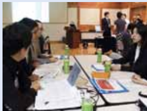
グループ討議。6グループに分かれ熱心な討論が行われました。