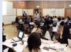
グループの代表者による発表（2日目）。短時間でパワーポイントにまとめてもらいました。すばらしい内容の発表でした。