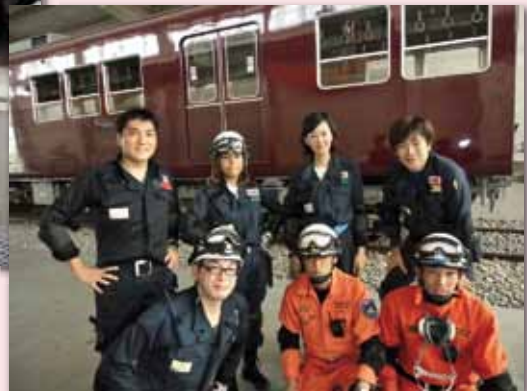
レスキュー隊員とともに、電車の下にもぐって傷病者を救出する訓練も行った。