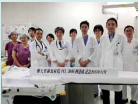
冠動脈カテーテル治療 3,000 例を達成!