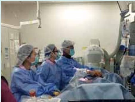
冠動脈のカテーテル治療を行っているところです。

スタッフは現在10名です。循環器疾患の多くなる冬を迎え、スタッフ一同、気を引き締めて診療に当たっております。今後も地域に根ざした循環器疾患の診療を行っていきますので、皆さまのご支援をよろしくお願いいたします。