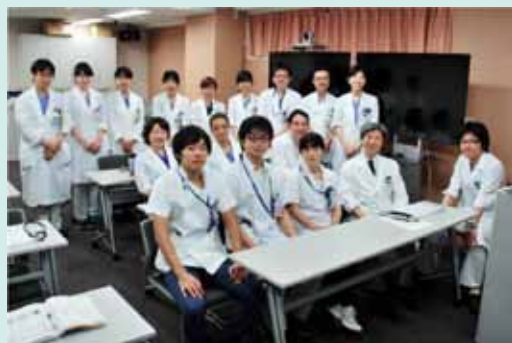
カンファレンスには、学生や研修医も多数参加します。