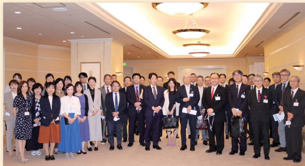
会終了後の当院スタッフ一同